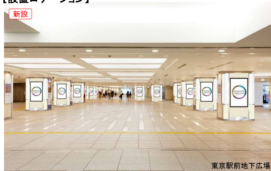
東京駅前地下広場