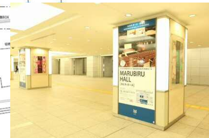
デジタルサイネージ 38面 シートセット(オプション) 16面