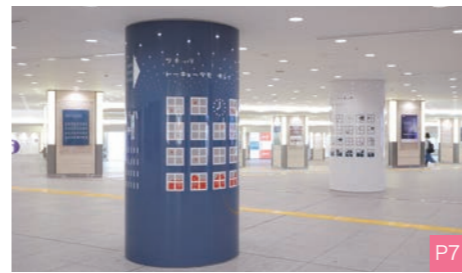
★JPタワー前地下広場