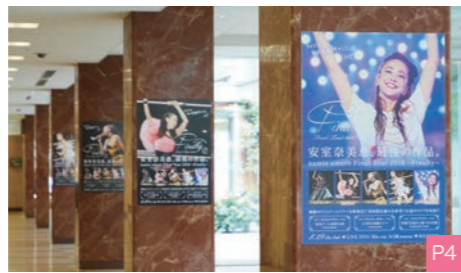
★Marunouchi Link Board

館内ポスター・柱付広告・ショーケース 平日のビジネスワーカーをはじめ、週末は広域なエリアから人が訪れ、常に多くの通行量を有する丸の内。その通行の要所となる箇所に配置した屋内メディアを通じて、人々に視覚的な訴求を行うことができます。