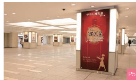
★東京駅前地下広場