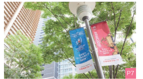
〰 丸の内仲通りフラッグ

丸の内の「街路灯フラッグ」は、来街者への告知効果はもちろん、通行中に高頻度で目にする事ができ、エリア一帯でのイベントの一体感を醸成。より一層のプロモーション効果が期待できます。